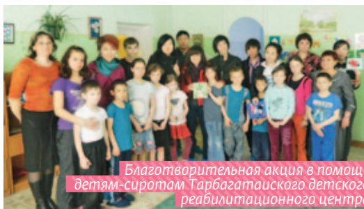
Благотворительная акция в помощь детям-сиротам Тарбагатайского детского реабилитационного центра